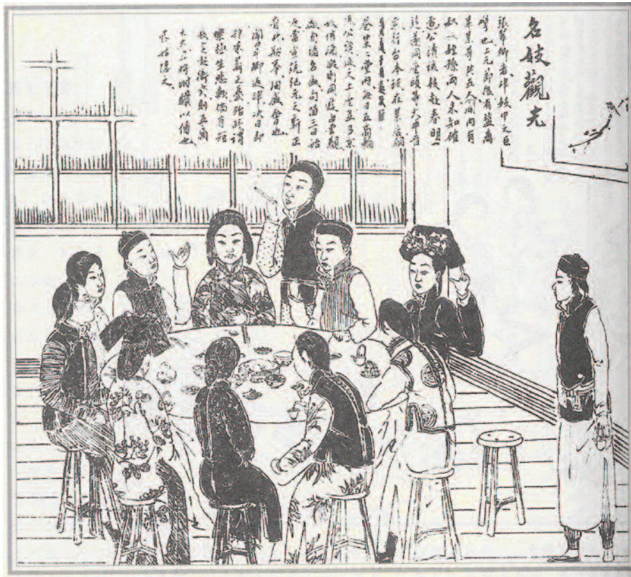
圖四 妓女文化是傳統中國的「精緻文化」。(取自溫世霖等《醒俗畫報》)

「橫痃雙生者，服藥十三日愈；單生便毒作筋疼者，服藥十九日愈；便毒潰破不斂，名為魚口，兼之疔瘡者，服藥廿六當愈」。 9 橫痃是梅毒的初期症狀，即腹股溝淋巴結腫大；便毒是指大腿根縫腫大，破潰之後稱為魚口，因瘡口潰大，身立則合、身屈則開，如魚口之狀名。 10 《霉瘡秘錄》又說：「夫霉瘡為患，正氣不虛則邪毒不入。如肝氣虛，邪毒乘之則發橫痃，或成魚口，甚則筋疼，瘡形如砂仁」，「凡染有毒之妓，或與患者接談，稍有所感，不拘便毒，疔瘡或髮際生瘡，梳下薄靨如麩，或手足肌膚紅點如斑隱肉」。 11 王韜頻頻出入花國，日記中錄有治霉瘡之方不難理解。